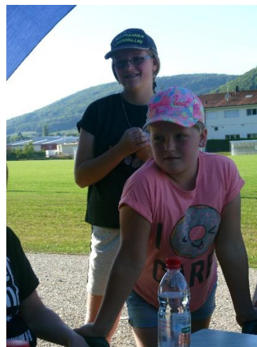
Borers Töchter = unser Nachwuchs?