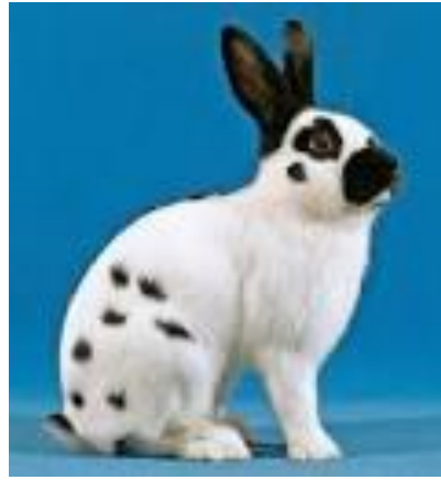
Tschechische Schecken züchtet Ruedi Leu